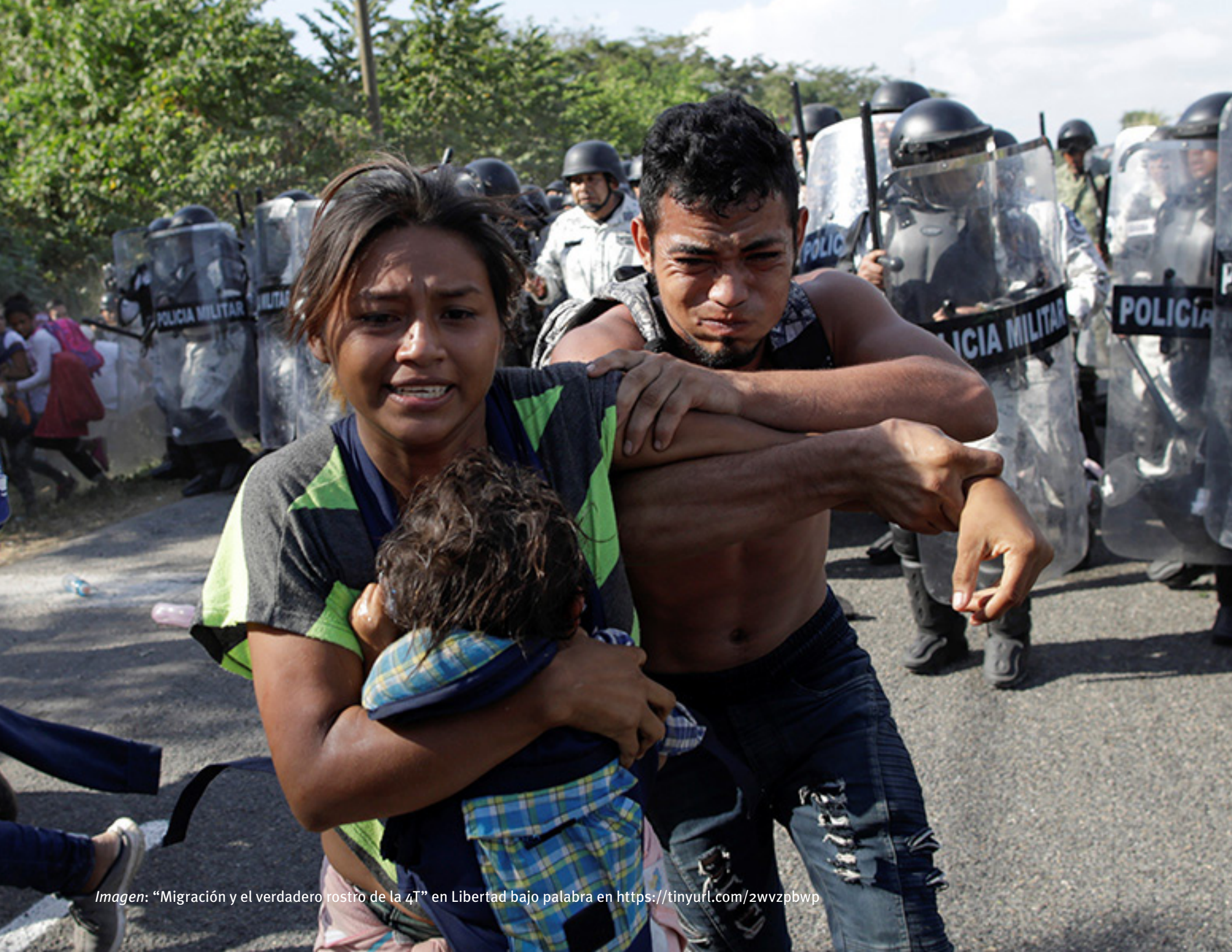
Imagen: "Migración y el verdadero rostro de la 4T" en Libertad bajo palabra en https://tinyurl.com/2wvzpbwp