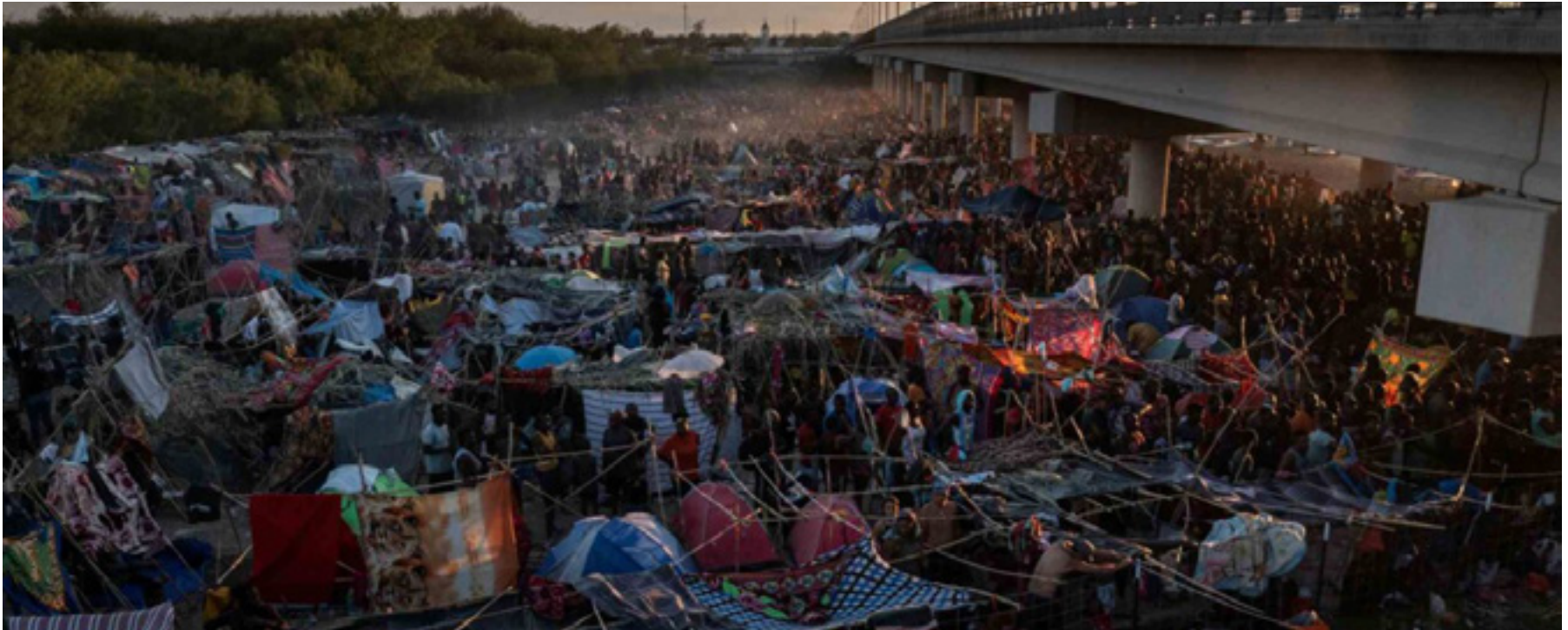
Imagen: “La crisis migratoria se intensifica con el campamento debajo de un puente en la frontera entre México y EU”

aún no incluyen los últimos flujos migratorios entre los que resalta el compuesto por personas de origen haitiano que, como reportaron diversos medios de comunicación, para el 18 de septiembre representaba una aglomeración de alrededor de 12 mil personas, todas hacinados debajo del puente que conecta la ciudad de Acuña con la ciudad Del Río. Asimismo, las autoridades texanas comunicaron que esperan la llegada de unos 8 mil migrantes más en los siguientes días (Europa Press, 2021). Después de la región de América Central, que representa el 90.7% (106 mil 253 detenciones) del total de detenciones, las regiones con más registros de este tipo son el caribe (5%) y América del Sur (2.5%) (USCBP, 2021).