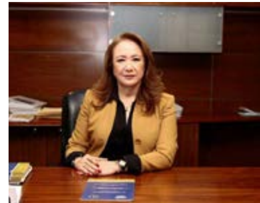
Ministra Yazmín Esquivel Mosso

Además, se renovaron tres asientos en la Suprema Corte de Justicia de la Nación (SCJN). De todos los nombramientos, 10 fueron de personas relacionadas con el partido en el poder y, en algunos casos, con el presidente directamente.