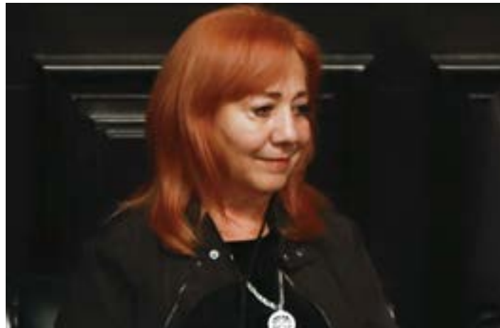
Rosario Piedra Ibarra, Presidenta de la CNDH en www.24horas.mx .

El artículo 102 apartado b de la Constitución señala que, al igual que los Consejeros de la CNDH, la o el presidente del órgano, será elegido por el voto de las dos terceras partes de los miembros presentes de la Cámara de Senadores, pero la actual titular de la CNDH sólo reunió 76 votos que equivalen al 65.5% de la asistencia en el pleno que fue de 116 senadores. Se argumentó que dos de los votos fueron en realidad una hoja en blanco y un sobre por lo que no fueron