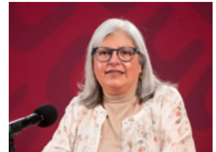
Imagen: “Graciela Márquez, presidenta del INEGI” en https://www.infobae.com/america/mexico/2021/12/15/graciela-marquez-ex-secretaria-de-economia-sera-propuesta-para-presidir-el-inegi/

El hecho es que las acciones encaminadas a la destrucción de información y las propuestas de desaparición de los órganos constitucionalmente autónomos por parte del presidente López Obrador y su gobierno, amenazan de manera permanente la democracia y ponen en riesgo la transparencia y el acceso a la información que permite el diseño y evaluación de políticas públicas robustas y efectivas. Es urgente y prioritario fortalecer y proteger la autonomía de es-