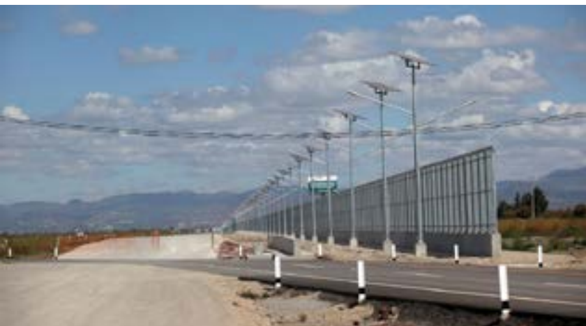
Imagen: Barra perimetral del NAIM.

y 2019, el Ejército mexicano pagó 2 mil 371 millones de pesos a 250 empresas que más adelante fueron declaradas como fantasmas por el SAT 13