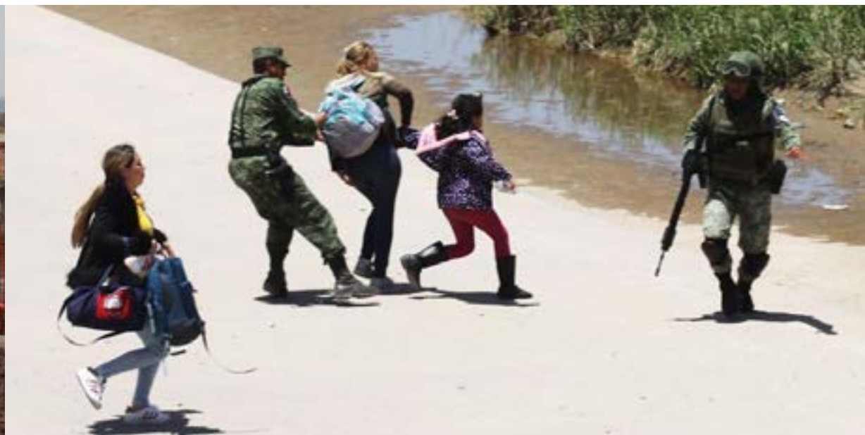
Imagen: Guardia nacional impide cruce de migrantes. Foto: Hérika Martínez/AFP/Getty Images. En https://tinyurl.com/y50s9qko

una falta legal, ya que en México no está permitido que una institución militar construya un aeropuerto civil y aunque el Presidente ha comentado que el aeropuerto también será militar, se sabe que la inmensa mayoría de los vuelos serán comerciales. El artículo 10 de la Ley de Aeropuertos establece que las concesiones de aeropuertos se otorgarán únicamente a sociedades mercantiles constituidas conforme a las leyes mexicanas e incluirán las actividades de administración, operación, explotación y, en su