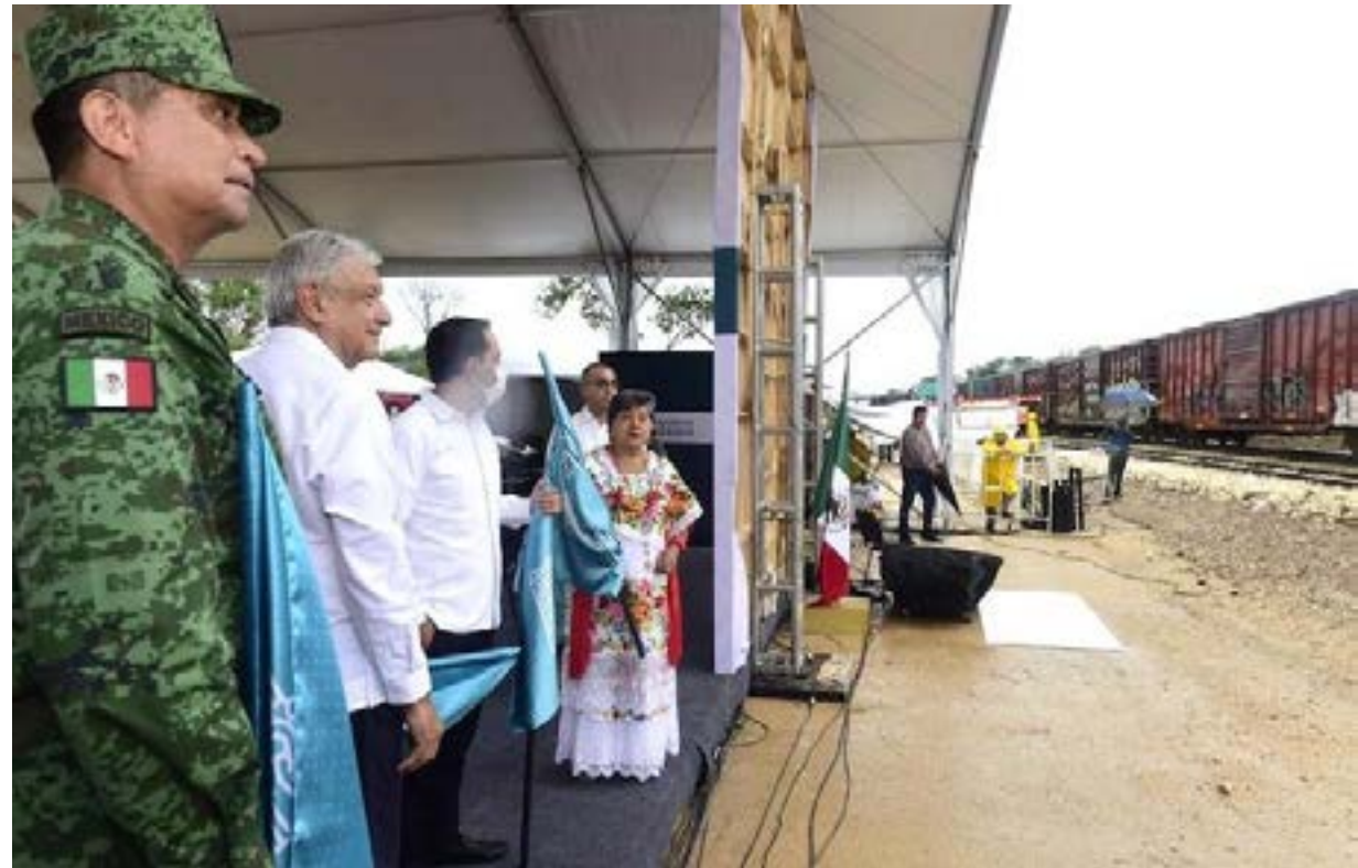
Imagen: El Presidente en segundo banderazo del tren maya en https://tinyurl.com/y3ro5yyb