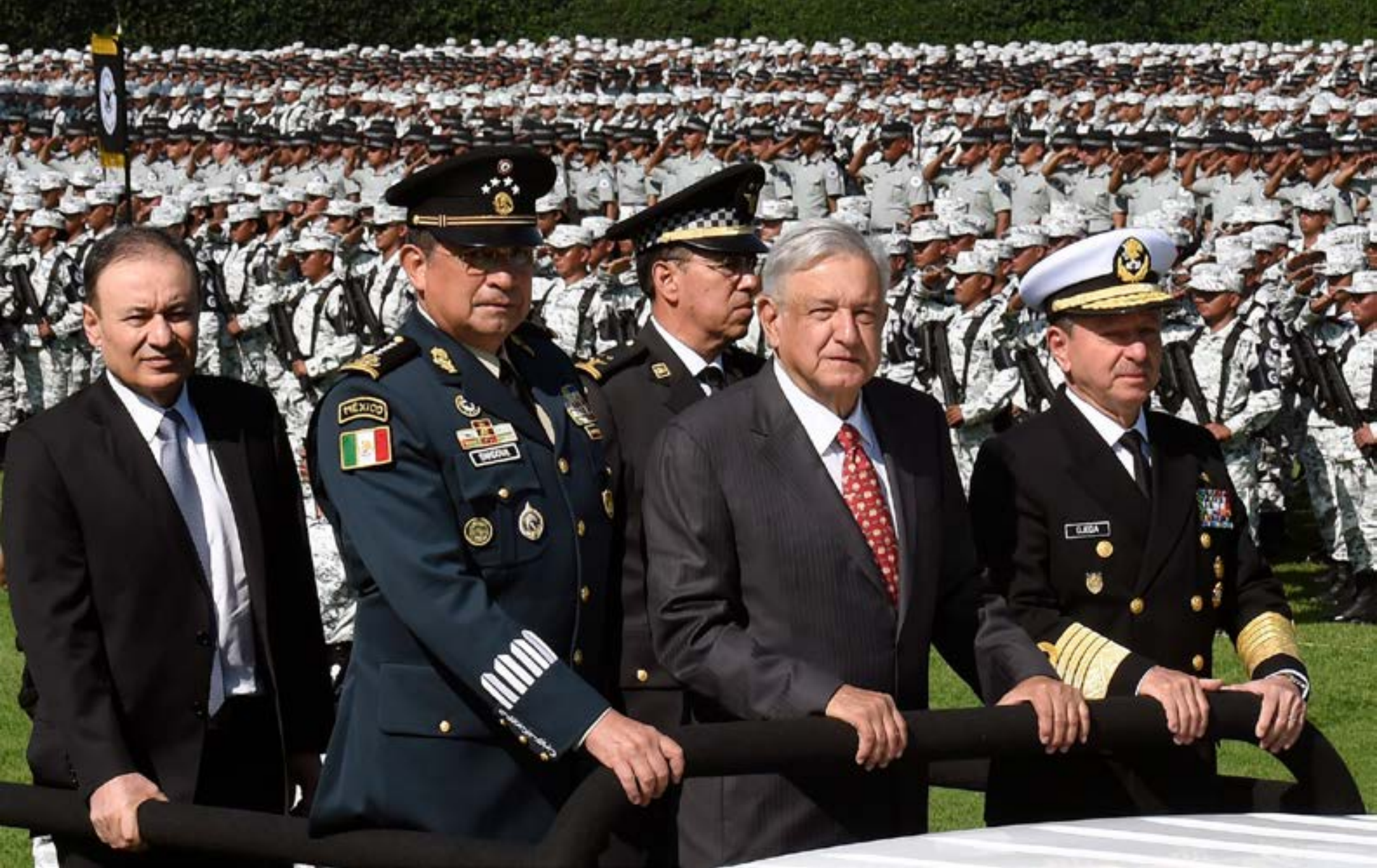
Imagen: El Presidente en la inauguración de la Guardia Nacional. Foto: Alfredo Estrella/Agence France-Presse — Getty Images. En https://tinyurl.com/y6gynnx3