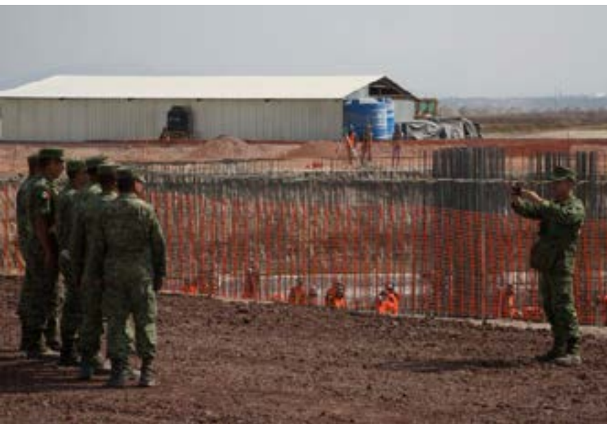
Imagen: militares en la construcción del aeropuerto Santa Lucía.

una falta legal, ya que en México no está permitido que una institución militar construya un aeropuerto civil y aunque el Presidente ha comentado que el aeropuerto también será militar, se sabe que la inmensa mayoría de los vuelos serán comerciales. El artículo 10 de la Ley de Aeropuertos establece que las concesiones de aeropuertos se otorgarán únicamente a sociedades mercantiles constituidas conforme a las leyes mexicanas e incluirán las actividades de administración, operación, explotación y, en su