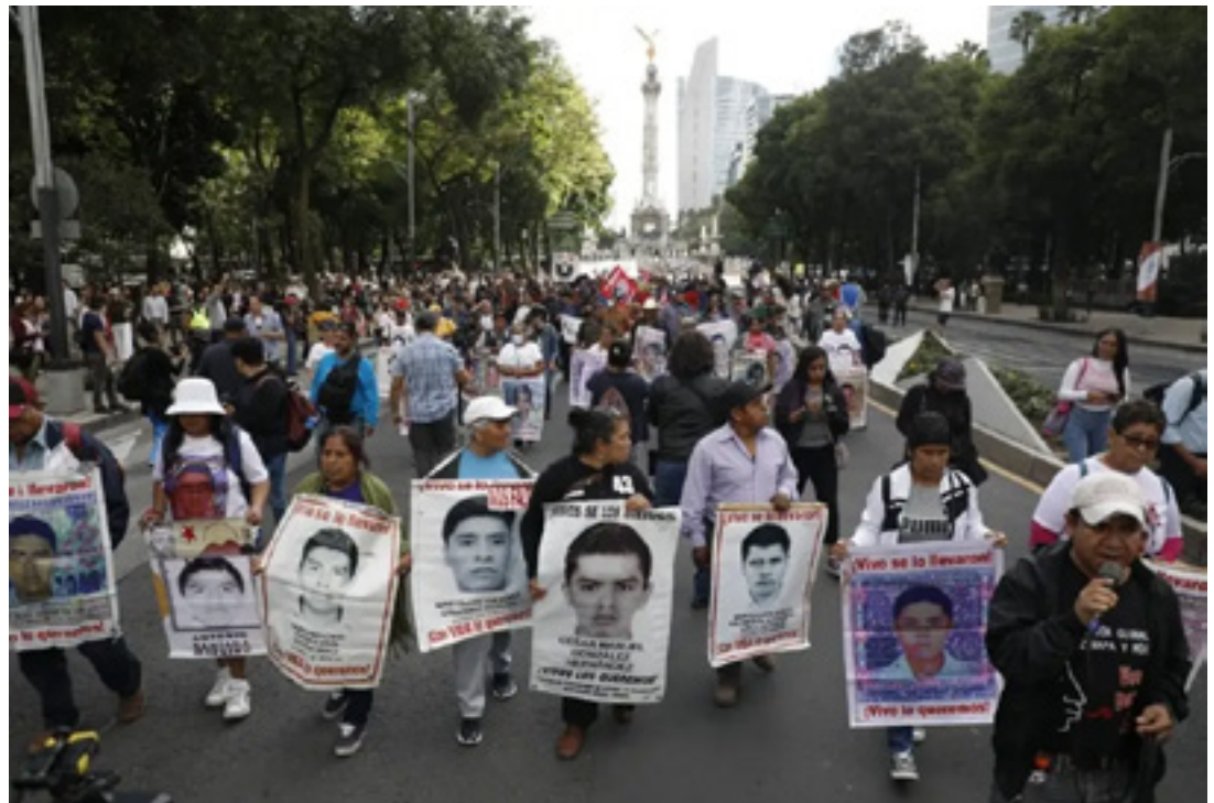
Imagen: "Década de fracaso" sentencian padres de los 43 de Ayotzinapa.

En el informe, el presidente argumentó que el Ejército entregó toda la información solicitada sobre el caso y concluyó que no hubo una participación directa de parte del ejército y el gobierno.