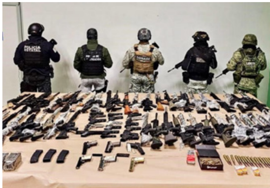
Imagen: "Decomiso de armas cae al nivel más bajo en tres sexenios" en https://www.elsoldemexico.com.mx/mexico/sociedad/decomiso-de-armas-cae-al-nivel-mas-bajo-en-tres-sexenios-11286406.html

En los últimos cinco años la caída en los decomisos de armas largas se presentó en 21 de las 32 entidades federativas (–53,972 aseguramientos) y en 11 estados ha habido alzas (2,488 aseguramientos). Sin embargo, ocho entidades encabezan la caída en los aseguramientos (87.9%): Chihuahua, Coahuila, Durango, Guerrero, Michoacán, Nuevo León, Sinaloa y Tamaulipas.