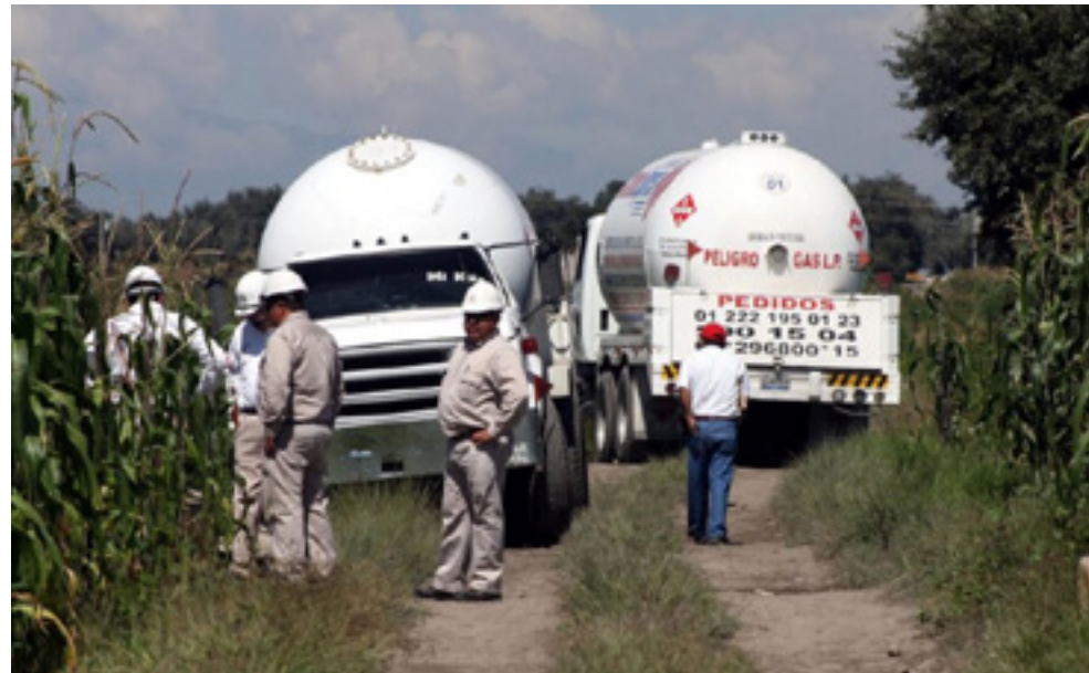
Imagen: "Aumentó el robo de Gas LP desde que la 4T inició su estrategia contra el huachicol " en https://www.infobae.com/america/mexico/2020/10/01/aumento-el-robo-de-gas-lp-desde-que-la-4t-inicio-su-estrategia-contra-el-huachicol/

Entre 2019 y 2024 los hallazgos de las tomas clandestinas de gas LP crecieron en 18.5% (crecimiento de 2,556 tomas) respecto del mismo periodo de la administración federal anterior (2013–2018).