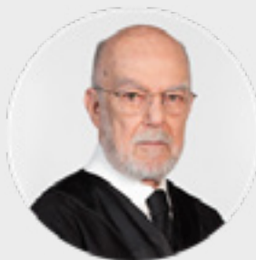
MINISTRO JUAN LUIS GONZÁLEZ ALCÁNTARA CARRANCÁ