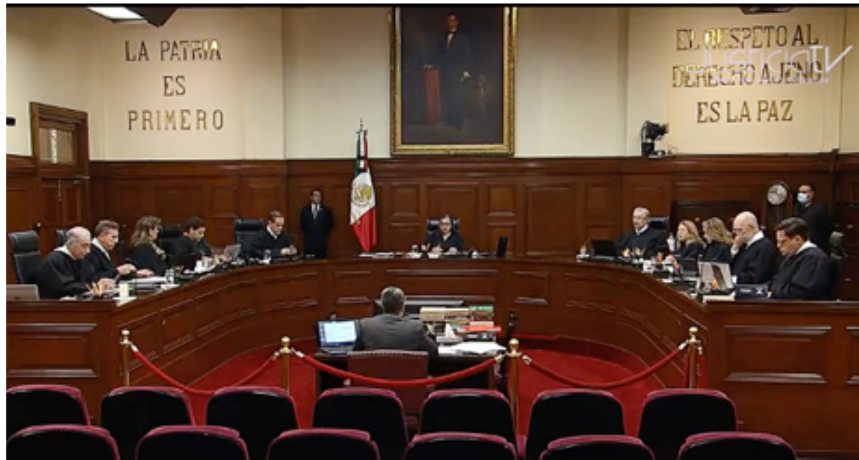
Imagen: sesión del 3 de octubre de 2024. SCJN en justiciatv en https://www.scjn.gob.mx/video/ .

Con esto, una consecuencia letal es que se pierda de vista que la principal función de la SCJN es la de controlar que el Legislativo y Ejecutivo cumplan con la Constitución, dando lugar a un sistema de pesos y