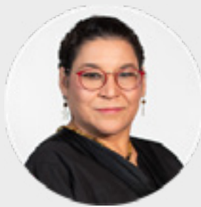
MINISTRA LENIA BATRES GUADARRAMA