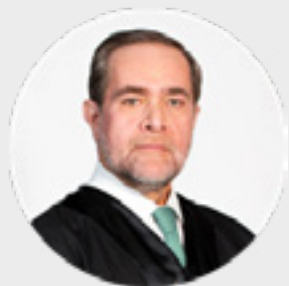
PRESIDENTE DE LA PRIMERA SALA