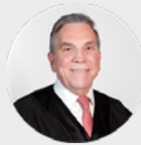
MINISTRO JAVIER LAYNEZ POTISEK