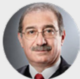
PRESIDENTE DE LA SEGUNDA SALA