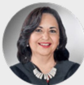
PRESIDENTA DE LA SUPREMA CORTE DE JUSTICIA DE LA NACIÓN