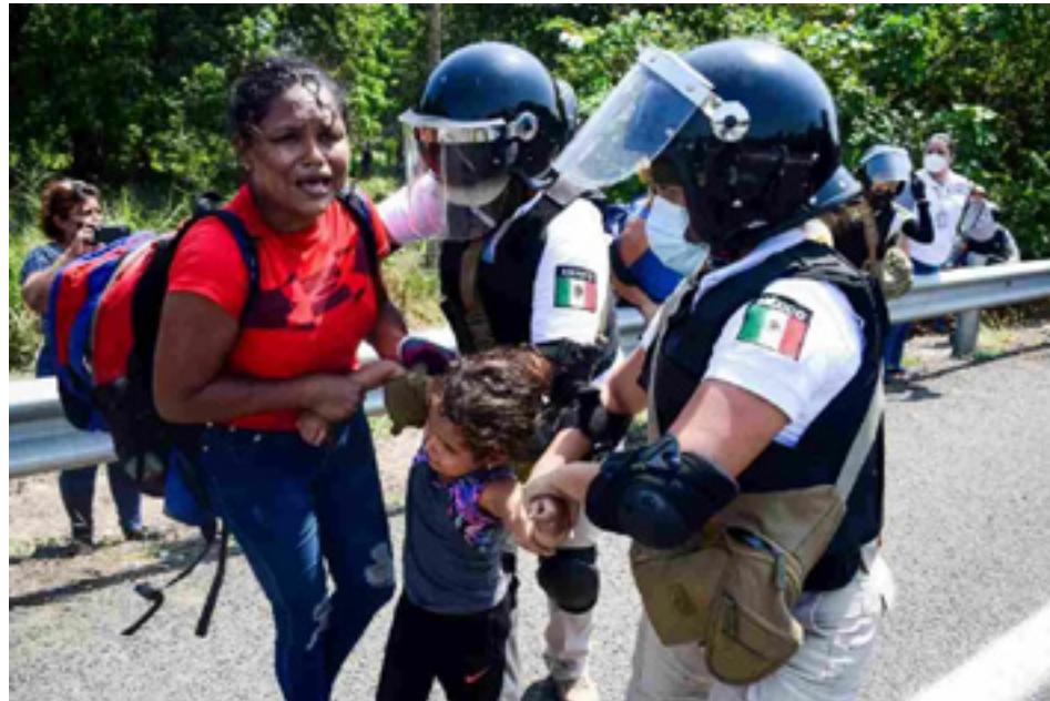
Imagen: "Detención de migrantes en México"

El argumento para justificar tal cantidad de responsabilidades (y presupuesto) asignadas a las FFAA, es que éstas podrían terminar con la corrupción que existía en esas áreas y, por tanto, se obtendrían ahorros relevantes. Sin embargo, los números no muestran ahorros relevantes.