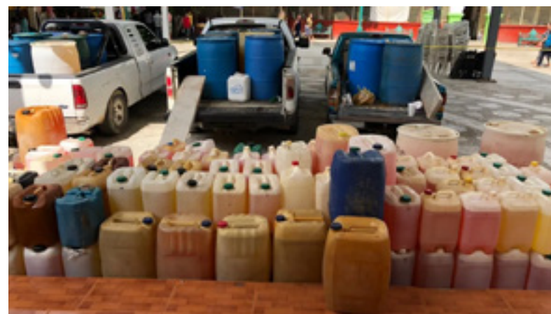
Imágenes: Huachicol en México. Foto Getty en https://www.bbc.com/mundo/noticias-america-latina-46831943 ;