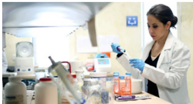
Imagen: Sin información sobre la situación de la ciencia en https://investigacion.uanl.mx/lidera-uanl-con-investigadores-nacionales-en-el-norte-de-mexico/

Para los años 2023 y 2024 ya no contamos con el Informe General del Estado de la Ciencia, Tecnología e Innovación. En dichos informes podíamos rescatar información específica respecto del sector científico como el gasto en investigación y desarrollo experimental, el gasto nacional en tecnología e innovación, los recursos humanos en ciencia y tecnología, el Sistema Nacional de Investigadores (número de investigadores, presupuesto, perfil de investiga-