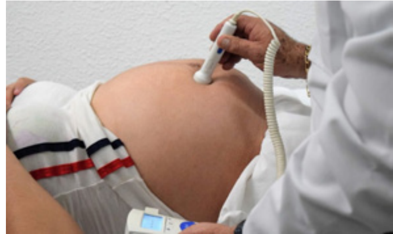
Imagen: Falta de indicadores de la situación de la salud, como la muerte materna en https://guerrero.quadratin.com.mx/guerrero-cuarto-lugar-nacional-con-mas-muertes-maternas-en-2024-salud/

De acuerdo al portal de la Secretaría de Salud (Sistema de Información de la Secretaría de Salud, Sinba), la mayoría de los indicadores en salud se encuentran desactualizados hasta junio de 2024 (Sinba, s.f). El número de nacimientos, de egresos hospitalarios, lesiones, urgencias y recursos en salud se encuentran con un rezago en la información. Dentro de los indicadores nacionales, la razón de mortalidad materna (número de muertes maternas por cada 100,000 nacidos vivos), que ha sido uno de los referentes clave para medir el desarrollo de los países, se encuentra actualizado sólo hasta 2023 . Pese a que la Secretaría de Salud publica un informe semanal de muerte materna por semana epidemiológica, éste no está actualizado sino hasta 2023 (Secretaría de Salud, 2025).