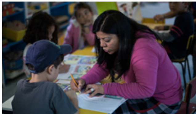
Imagen: El Siged, informaba sobre la situación de alumnos y docentes, en https://www.mexicosocial.org/maestros-en-mexico-educar-en-la-desigualdad/

tránsito escolar exitoso. Un rubro adicional que llenaba el Siged es el Fondo de Aportaciones para la Nómina Educativa y Gasto Operativo (Fone), que es la fuente de información de los maestros pertenecientes a subsistemas que la federación controla. Dicha información permite la construcción de indicadores estratégicos y de gestión con el fin de conocer si las metas educativas son factibles de alcanzar, si son ambiguas o si son laxas. Asimismo, la información permite una valoración integral del desempeño del fondo para ubicar fortalezas, oportunidades, debilidades y amenazas. Además, los insumos generados son usados para la construcción de indicadores que contribuyen a la evaluación del Sistema Educativo Nacional (SEN), que estuvo a cargo del Instituto Nacional para la Evaluación de la Educación (INEE) hasta su desaparición en 2019 (Signos Vitales, 2023).