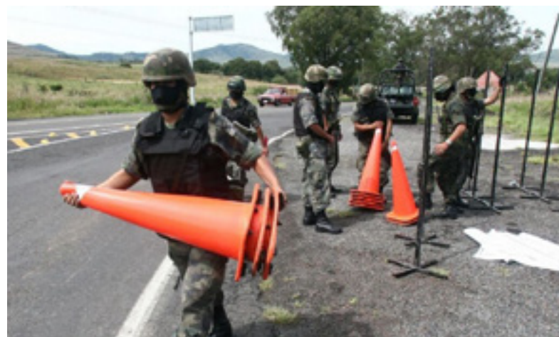
Imagen: La Sedena se encargará del mantenimiento de carreteras federales”

En este sentido, el indicador de la actividad de la construcción puede encontrarse comprometido por la subestimación de las obras de ingeniería del gobierno (en todos sus niveles) . Los gobiernos pueden estar incentivados a subestimar el valor de las obras públicas. A pesar de que el indicador no ha dejado de publicarse de manera oportuna, las estimaciones oficiales perdieron credibilidad al menos en los últimos dos años.