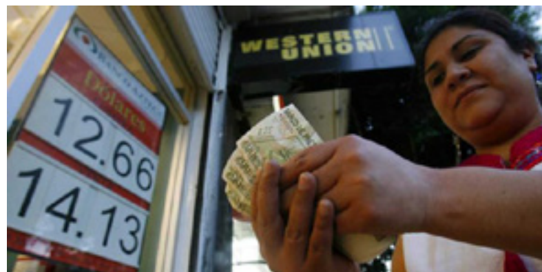
Imagen: Envío de remesas a México en https://panampost.com/orlando-avendano/2016/03/01/enero-es-el-mejor-mes-para-las-remesas-en-mexico-desde-2006/

Para los datos de remesas no hay un sustituto perfecto. Los datos disponibles a través de encuestas no resultan tan precisos (en el agregado) como el de los registros ad-