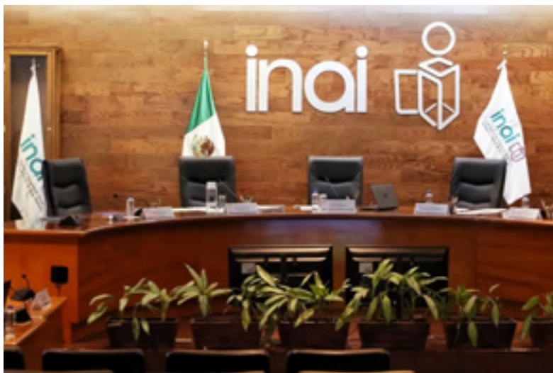
Imagen: Cancelan sesión del INAI en https://www.sergiovalle.mx/cancelan-sesion-del-pleno-en-el-inai-por-falta-de-quorum/

a México en el lugar 140 de la percepción de corrupción en México. El desmantelamiento de instituciones autónomas como es el caso del INAI implica un riesgo para el estado de derecho y transparencia, ya que la rendición de cuentas del gobierno se ve implicada. Como consecuencia de ello, el combate a la corrupción se vuelve más difícil sin tener un análisis de la realidad.